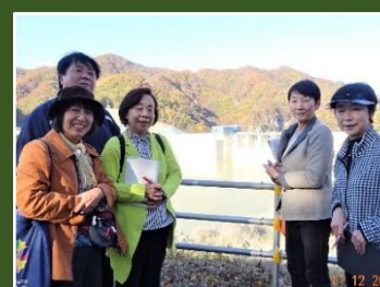
台風19号の後のハッ場ダムを視察(11/12)