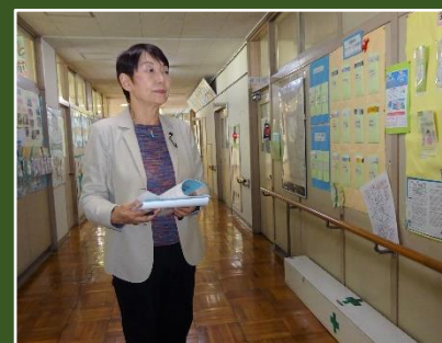
柏特別支援学校を視察(11/14)