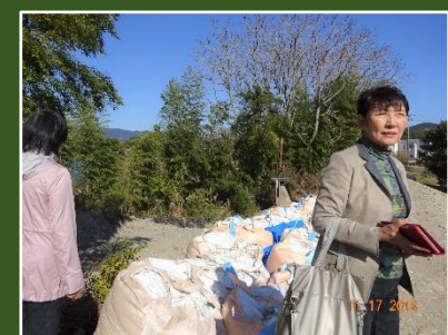
福島県いわき市の台風19号被災地で河川の決壊状況を視察(11/17)