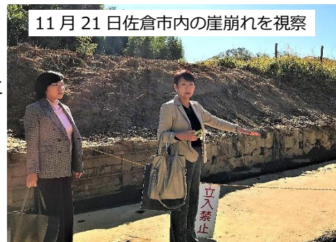
11月21日佐倉市内の崖崩れを視察

農業用ハウスや共同作業場など対象が制限され、ハードルが高い。もっと使いやすい制度にすべき。