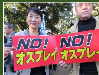
オスプレイ反対集会(習志野市11/10)