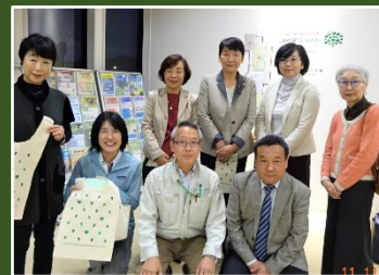
睦沢町の新電力を視察(11/11)