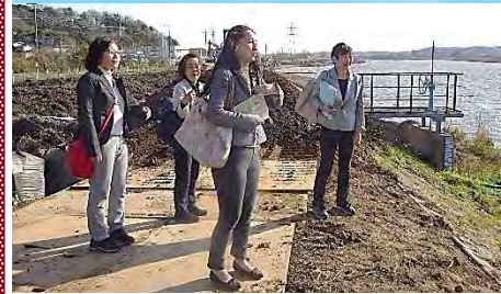
3月19日、鹿島川右岸の築堤工事を視察。(下図赤い箇所)