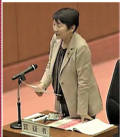
3月3日、予算委員会にて野田市の児童虐待死事件について質問。

佐倉市の水道水は、地下水の割合を減らされ、高い利根川の水が増えるので、水道料金の値上げが心配です。料金を抑えるため、受水費削減を全力で求めています。