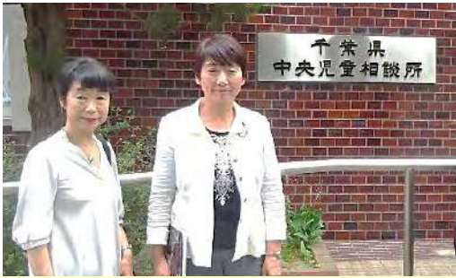
6月4日千葉県中央児童相談所を訪問。狭く老朽化したため来年移転します。しかし増え続ける一時保護児童数に、人手もスペースも追いつきません。重い課題に真摯に取り組んでいます。

まだまだ十分な対策とは言えませんが引き続きしっかりと対策を講じるよう求めています。