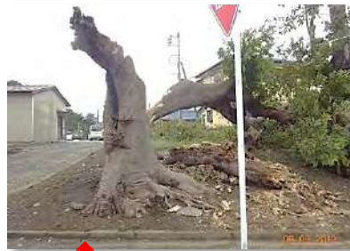
けやきが真っ二つ!(上座)