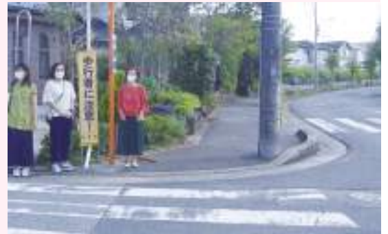
↑市民から相談のあった、青菅小学校(宮ノ台)の危険な通学路を調査しました。

私たちの元には、身近な危険箇所の情報がたくさん寄せられています。一つ一つ現地調査を進めています。