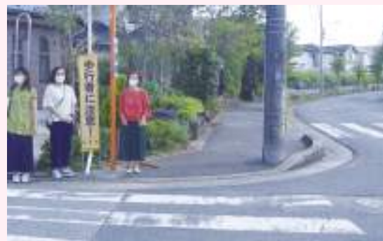
↑市民から相談のあった、青菅小学校(宮ノ台)の危険な通学路を調査しました。

私たちの元には、身近な危険箇所の情報がたくさん寄せられています。一つ一つ現地調査を進めています。