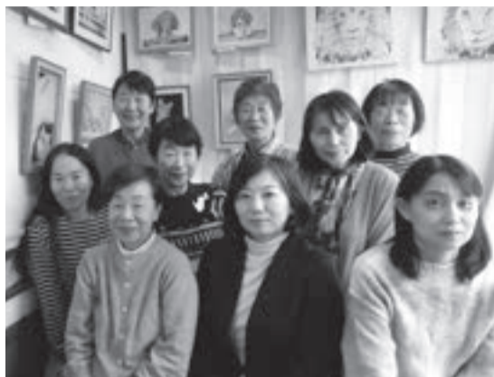
今年もよろしくお祈りします。