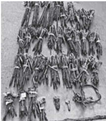
↑50m走コースから抜き取った釘305本。6月から8月で校庭で見つかったのは計500本近くに。